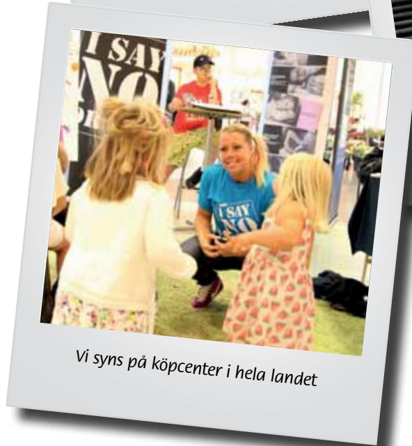
Vi syns på köpcenter i hela landet