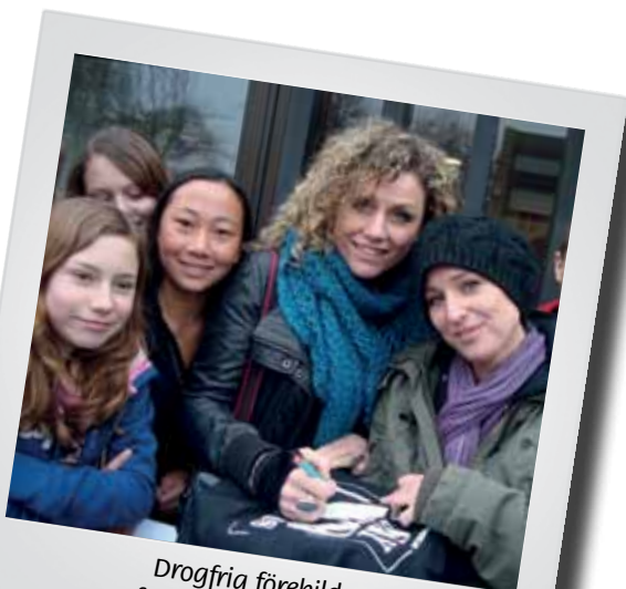
Drogfria förebilder föreläsningar i skolor

Vi har alltid funnits på plats och arrangerat/medverkat på många event och utställningar. På mässor, läger, köpcentrum torg, bibliotek, skolor m.fl. Syftet är att inspirera och hjälpa genom att föreläsa och dela ut informationsmaterial.