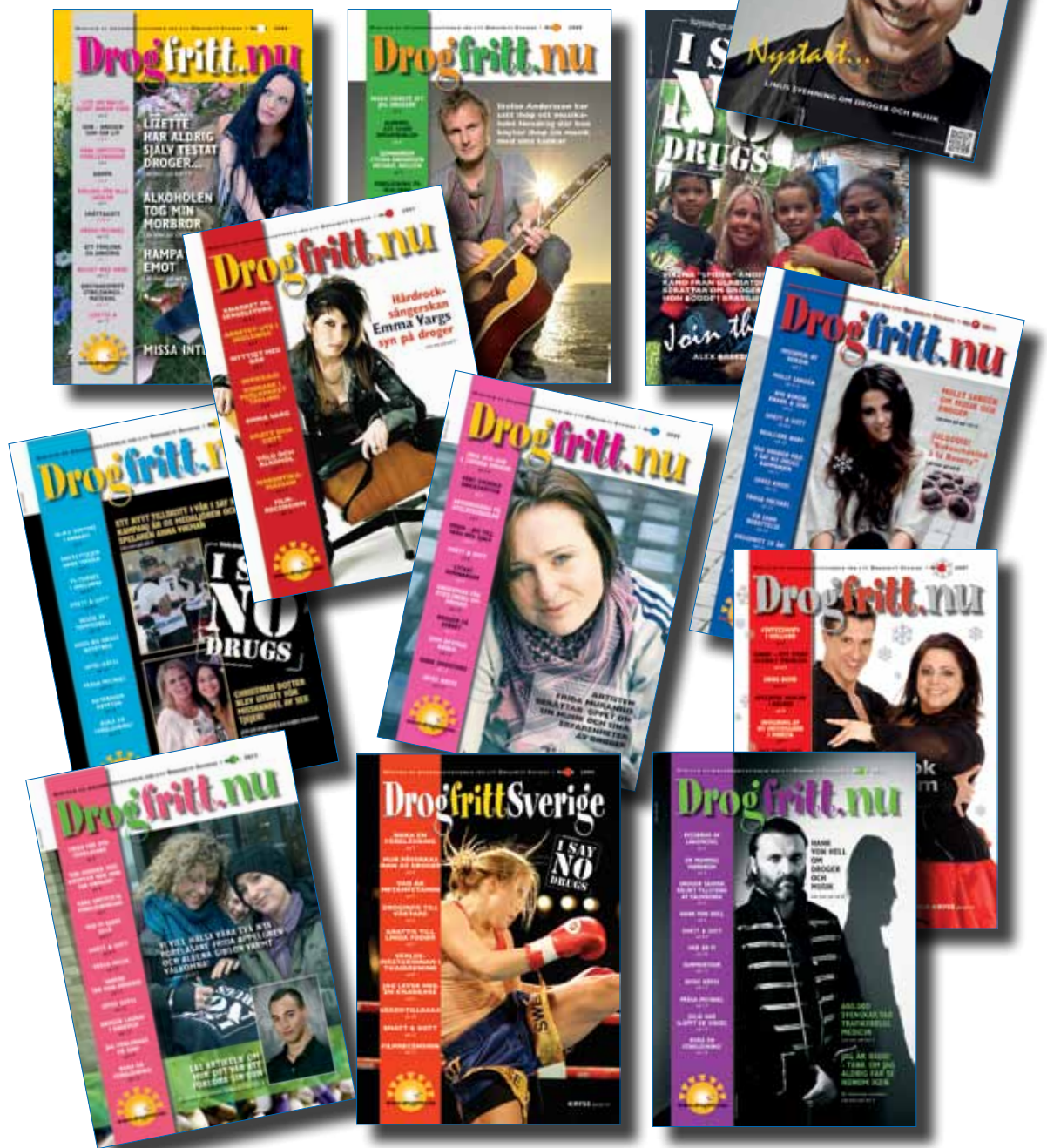
Tidningarna innehåller fakta om droger, kända förebilder m.m.