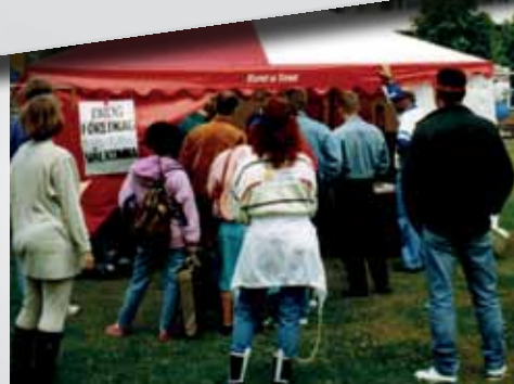
Föredrag 1993 vårt allra första event i Stenungssund