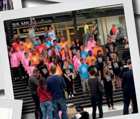
Inspelning av musikvideo om droger