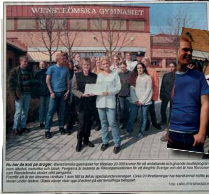
Nu har de koll på droger. Wenströmska gymnasiet har tilldelats 20 000 kronor för ett omfattande och givande studieprogram inom alkohol, narkotika och tobak. Pengarna är skänkta av Riksorganisationen för ett drogfritt Sverige och det är hon Naroncon som Wenströmska skolan sökt pengarna. Framtiden är det eleverna i årets 1 som fått ta del av specialundervisningen. Cirka 20 föreläsningar har bland annat hållits på skolan under läsåret. Glädda elever visar upp checken på det himlafärga bekket.