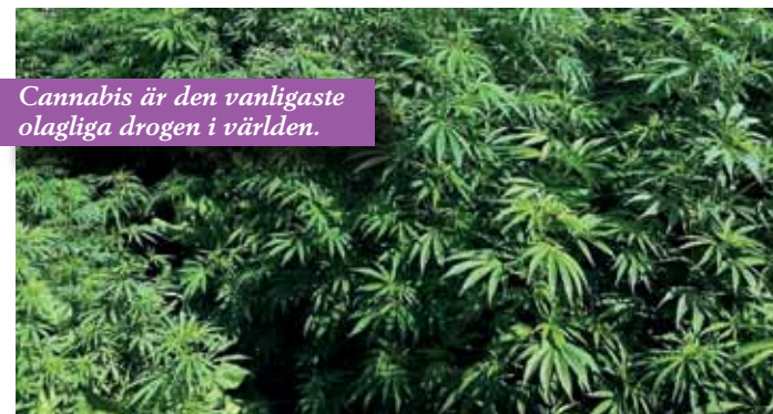
Cannabis är den vanligaste olagliga drogen i världen.

Källa: http://www.svt.se/nyheter/vetenskap/marijuana-forandrar-hjarnan